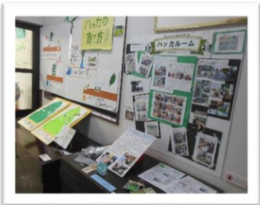
■ハッカ学習の取り組みと手作りのハッカポップ(高掬小)