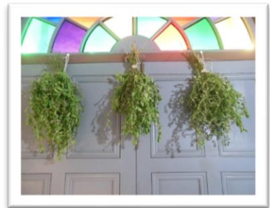
■収穫したハッカのスワッグ♪