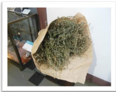
■乾燥させたハッカのブーケ♪