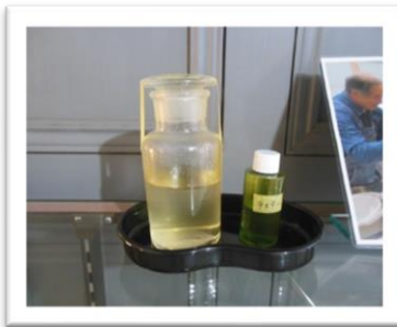
■ハッカが香る蒸留水♪