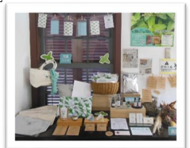
■ハッカグッズを展示中♪